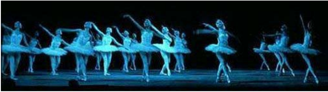
El lago de los cisnes

A mediados del siglo XIX el éxito del ballet alcanza Rusia. De esta forma culmina el gran viaje empezado en Egipto, pasando a Grecia, de Grecia a Italia, luego a Francia y por fin triunfa en Rusia. El ballet romántico empezada a perder interés en París y Londres, cuando el joven bailarín Marius Petita recibió la mejor oferta que en aquel momento se podía hacer. En 1847 el director del teatro imperial de San Petersburgo le invitaba a convertirse en el “primer danseur” con un sueldo de 10.000 francos al año. Rusia estaba sentando las bases para convertirse así durante 60 años en el centro de la danza en el mundo occidental. Grandes ballets clásicos como “ Don Quijote ”, “ La Bayadera ”, “ El lago de los Cisnes ”, o “ La Bella Durmiente ” ven la luz en esta época de esplendor para el ballet en Rusia.