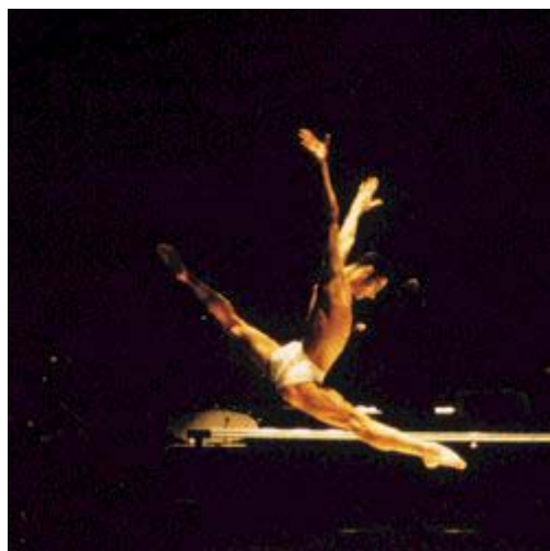
Ballet de Biarritz

El Ballet de Biarritz responde un poco a una iniciativa conjunta de la ciudad de Biarritz, Ministerio de Cultura y Consejo General de los Pirineos Atlánticos que en septiembre de 1988 posibilitó la creación e inauguración del centro coreográfico localizado hoy en día en la antigua Estación del Centro de Biarritz.