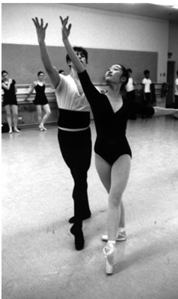
Escuela de Ballet

La compañía deberá disponer de su propia Escuela de Ballet donde los bailarines seleccionados entre los más destacados de las academias, escuelas de música o conservatorios, puedan perfeccionar su técnica y convertirse en bailarines profesionales. Esto implica la disponibilidad de locales y de personal adecuado para formar nuestros bailarines de futuro. La escuela debe prestar atención a la educación adicional de los niños / jóvenes.