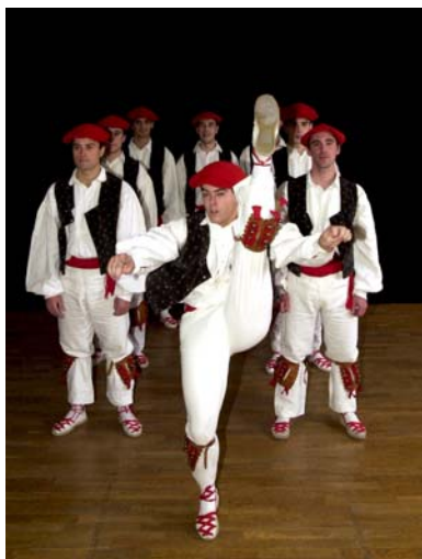
Bizkaiko dantzaridantza (posición del artazi equivalente al grand battement en ballet clásico)

A pesar de que nuestra danza ha permanecido fundamentalmente dentro de nuestras fronteras, nuestra fama de buenos bailarines y la calidad de nuestros pasos no ha pasado desapercibida para los grandes maestros de la danza. De hecho en las “ comedies-ballets ”, resultado del trabajo conjunto entre Moliere y Lulli, es posible comprobar la presencia de bailarines vascos para aquellas partes en las cuales la coreografía requiere la máxima virtuosidad.