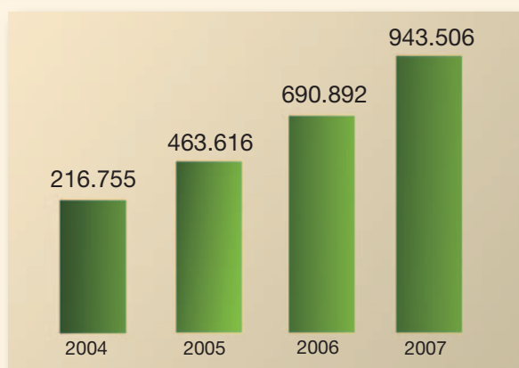
Evolución de las consultas al OPAC 2004-2007 (Fuente: absysNET)

Consultas al OPAC. Durante 2007 se han realizado más de 900.000 consultas al OPAC del catálogo, 250.000 más que durante 2006, lo que supone un aumento del 27% en uso de los servicios on-line que ofrece la Red.