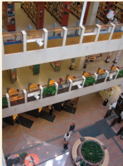
Biblioteca de Göteborg

El recorrido comenzó en Estocolmo con la visita a la Biblioteca Internacional, que cuenta con una colección de 220.000 títulos, de los cuales 9.000 están en español. Es importante también el fondo en ruso, árabe, persa y chino y así hasta un total de 120 lenguas.